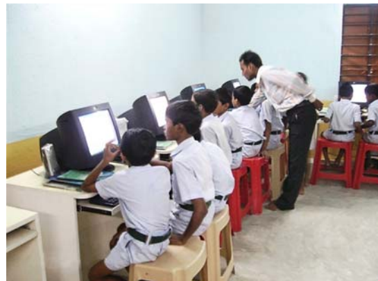
Das Balashram Computerlabor

Um den Unterricht anschaulicher zu gestalten, werden für alle Klassen außerdem folgende Lehrmittel gebraucht: ein Overhead Projektor, anatomische Modelle des Körpers, Geometriemodelle, 3-D-Landkarten, Lehrtafeln zu den Themen Umweltschutz, Gesundheit und Hygiene, Verkehrssysteme, Demographie, Geographie und Astronomie . Für die Kinder der Vorschule und des Kindergartens mangelt es zudem an Lernspielzeug aller Art.